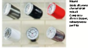
Alcuni Static di Lorenza, che nella foto veste il Cappotto di Sapper, riproposto per Pisa

Lo Static del designer Richard Sapper versione personalizzata per Pisa Orologeria