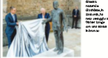
Il monumento a Walter Lange, in Sassonia, ha nei dettagli il nome di Walter Lange con un'area in bronzo

Un memoriale per Walter Lange pioniere della manifattura Sassone