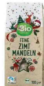
Sono pralinate le MANDORLE bio con cannella. Di dm bio by drogerie markt (2,69 €).