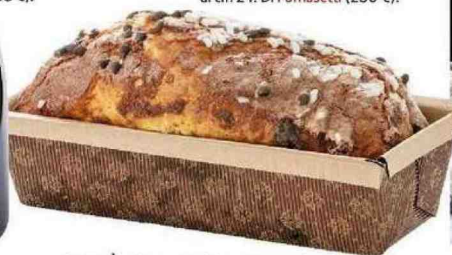
Il PANDI ha l'impasto del panettone e farcia, tra le altre, di fichi e cioccolato. Di Bottega del ristorante Il Nazionale di Vernante (12 €).

Nella cappelliera tre bottiglie di PROSECCO Valdobbiadene Superiore docg. Di Follador (64 €).