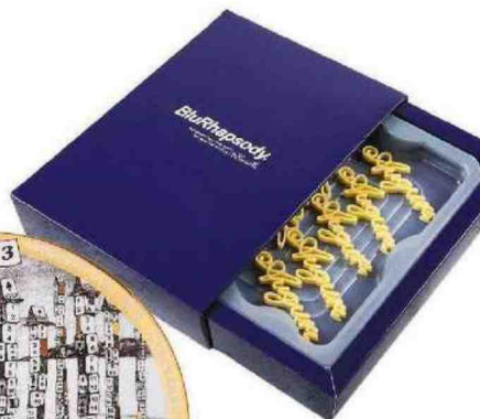
PASTA décor ideale per guarnire mousse, creme e pietanze. Di BluRhapsody by Barilla (12 pezzi 16,90 €).

Con undici botaniche, tra cui alloro, finocchietto selvatico e rosmarino, il GIN Villa Ugo. Di Sabatini Gin (32 €).