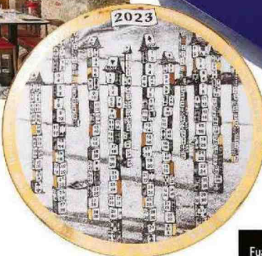
In porcellana e dettagli in oro il PIATTO Calendario 2023 in edizione limitata, diametro di cm 24. Di Fornasetti (280 €).