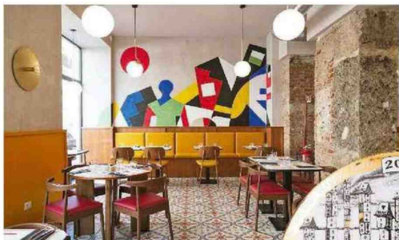
A Milano, in Via Settima 16 e in altre cinque sedi, c'è Lievità, la PIZZERIA dove provare pizze napoletane gourmet e molto altro ( pizzeria-lievita.com ).